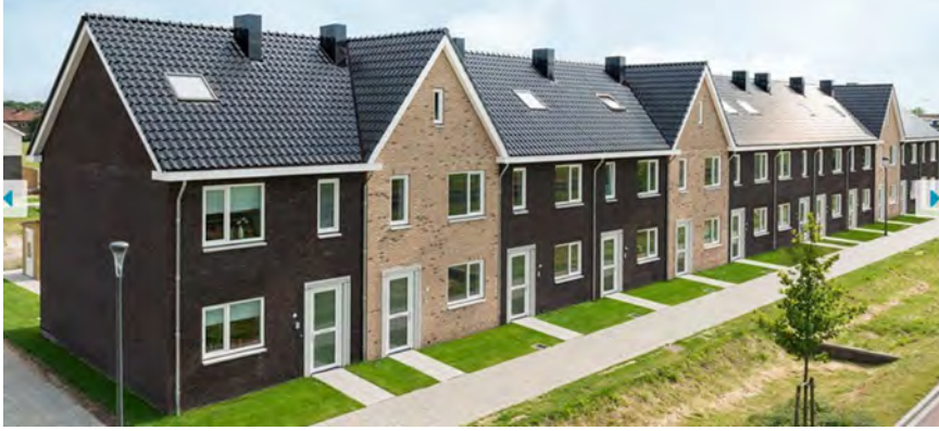
-Figuur 1- Woningen in Holten, Overijssel